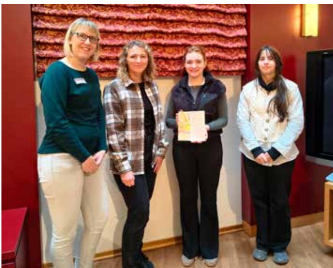
Dozentin und Studentinnen der TU-Chemnitz

Die Treffen fanden in den jeweiligen Gästezimmern statt. Das Gemeinschaftsprojekt im Fach Grundschuldidaktik „Intergenerationelles Lernen – übereinander“ soll eine Verbindung zwischen den verschiedenen Generationen aufbauen. Der Dozentin ist es wichtig, dass die zukünftigen Lehrkräfte ihren Sprösslingen den Bezug zu älteren Menschen durch z.B. einen Besuch im Altenpflegeheim näherbringen. Damit die Lehrenden selbst auch ein