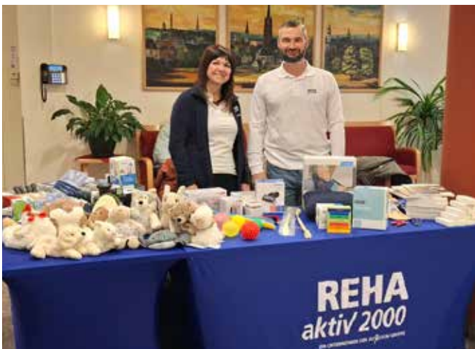
Unser Partner für Hilfsmittel