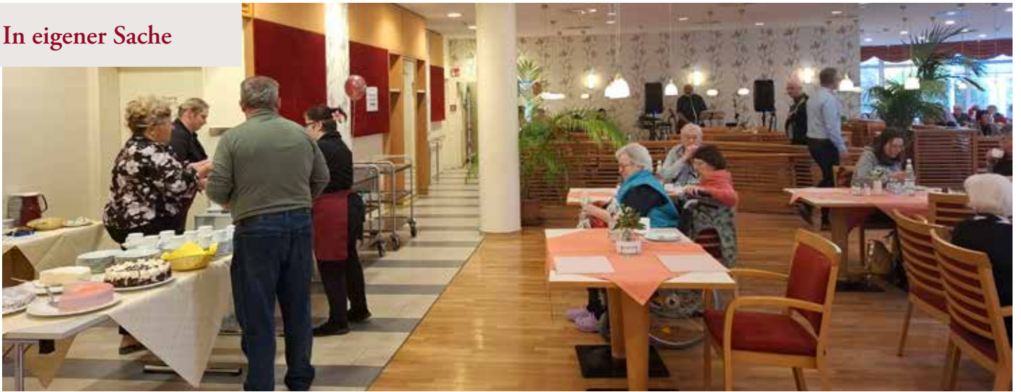
Leckereien im Restaurant genießen