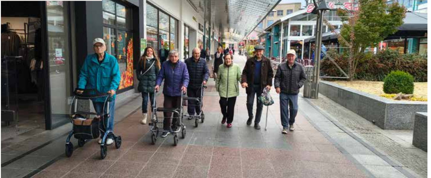
An den Geschäften vorbei schlendern