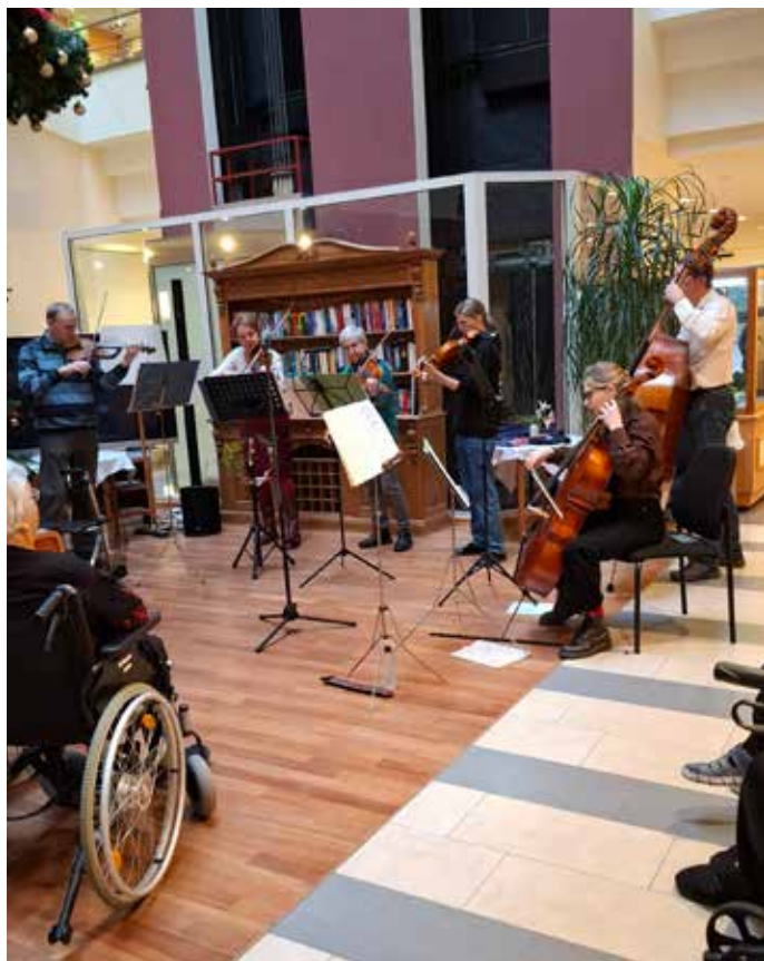
Kultur am 2. Advent