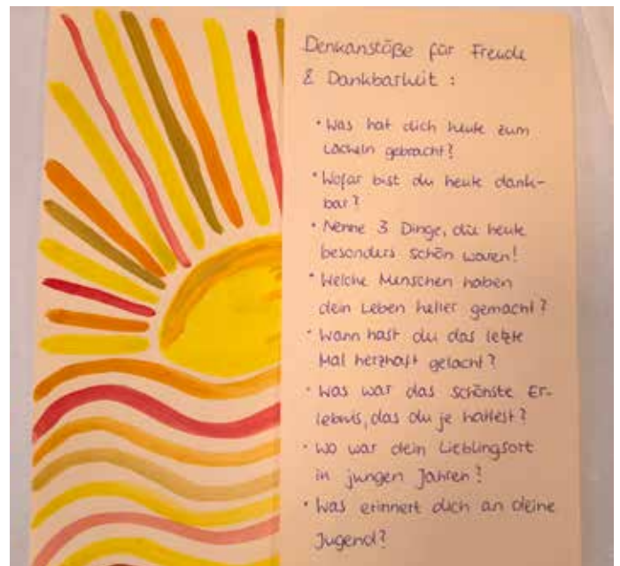
Die Denkanstöße für Freude