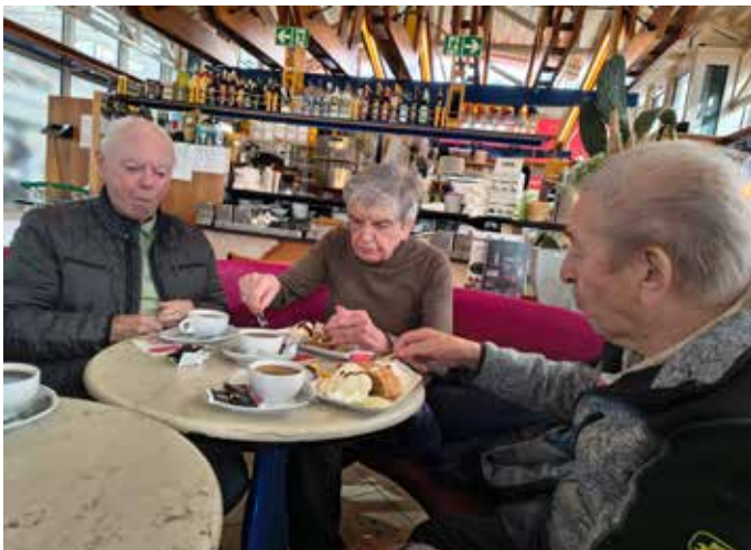
Apfelstrudel mit Vanilleeis

wurden wir dann herzlich im Eis-Café Rialto begrüßt. Wir bestellten die Empfehlung des Hauses: warmer Apfelstrudel mit Sahne und einer Kugel Vanilleeis. Aber auch eine „Heiße Liebe“ und ein Schlückchen Eierlikör durften bei einigen Gästen nicht fehlen. Wir genossen bei einer Tasse Kaffee und italienischer Musik das bunte Treiben im Center. Unser ge-meinsames Fazit dieses Ausfluges: Das kön-nen wir gerne wiederholen.