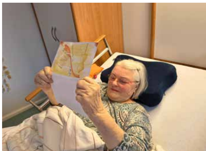
Unser ehemaliges Mannequin

„Meine beiden Töchter sind mir wahnsinnig wichtig. Trotz ihres großen Altersunterschiedes von 10 Jahren haben sie ein enges Verhältnis und verstehen sich immer gut. Sie kommen mich regelmäßig besuchen.“