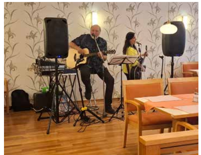
Unser musikalisches Highlight