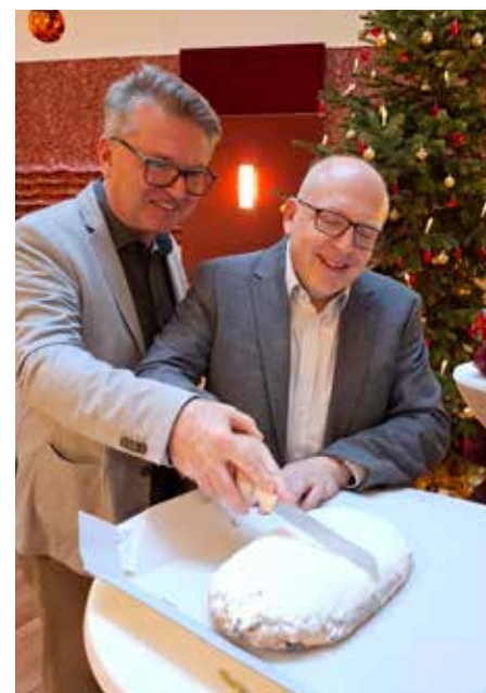
Gemeinsames Stollen anschneiden

Auch eine Bescherung durfte nicht fehlen. Das SenVital erhielt einen Präsentkorb mit vielen Leckereien. Wir überreichten dem Oberbürgermeister eine Sammlung unserer Hauszeitung „Niklasberggeflüster“, damit er noch einen besseren Einblick über unser Haus gewinnen kann.