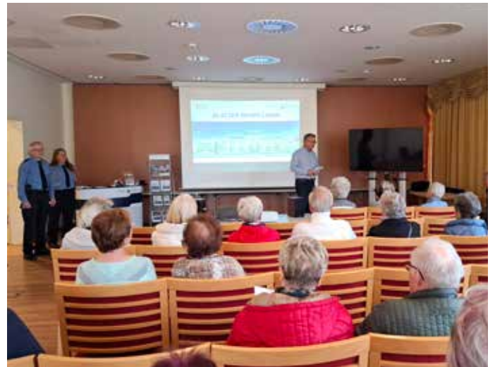
Vortrag der Polizeidirektion

Auch vor der Residenz konnten Gäste, Angehörige und Besuchende bei köstlichem Essen und Getränken sowie herrlichem Spätsommerwetter plaudern und sich austauschen. Herzlichen Dank an alle, die dabei waren und an alle, die diesen Tag so wunderbar mit ausgestaltet haben! Übrigens: Auch außerhalb unserer einmal im Jahr stattfindenden „Schau-mal-rein-Tage“ können Sie uns gern jederzeit für ein Informationsgespräch kontaktieren. Innerhalb eines vereinbarten Termins oder auch telefonisch, können so erste grundlegende Fragen beantwortet werden.