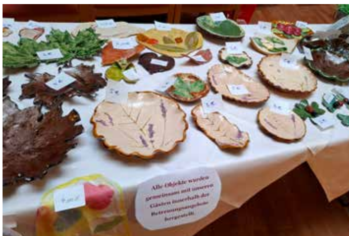
Keramikprodukte unserer AG