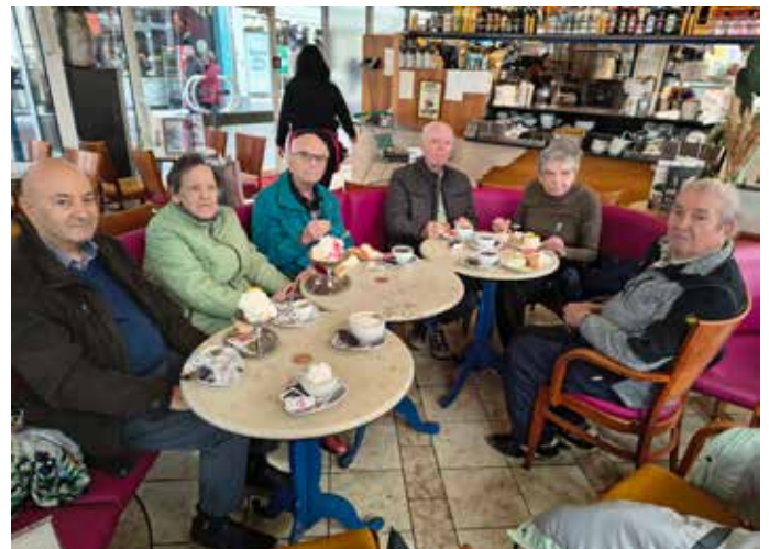
In gemütlicher Runde