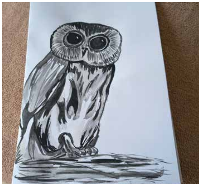
Kreative Gestaltung einer Eule

„Ich hatte das Glück bei der Geburt meiner 1. Enkelin dabei zu sein. Ich habe das Köpfchen gehalten und sie in dieser Welt in Empfang genommen, mittlerweile ist sie 37 Jahre alt.“