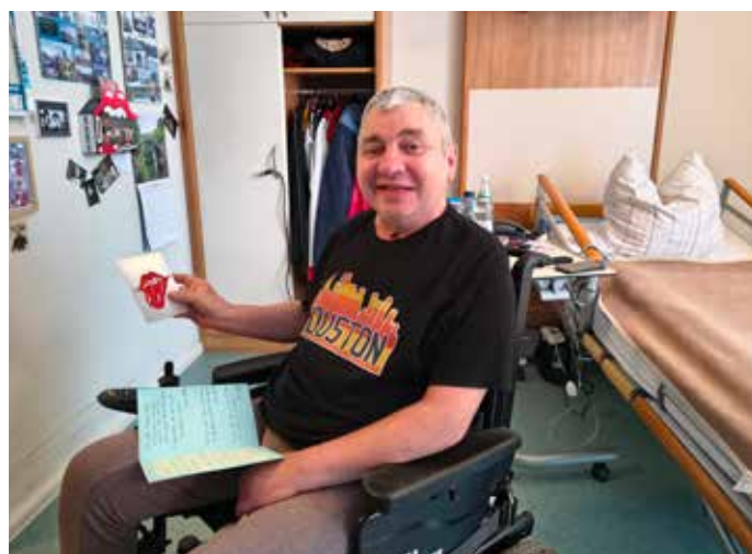
Große Freude über das Logo der Rolling Stones

„Ich fand es in der Tschechei im Riesengebirge, Spindlermühle oder in der Region Liberec sehr schön. Dort habe ich regelmäßig Urlaub mit meiner Mama zusammen gemacht.“