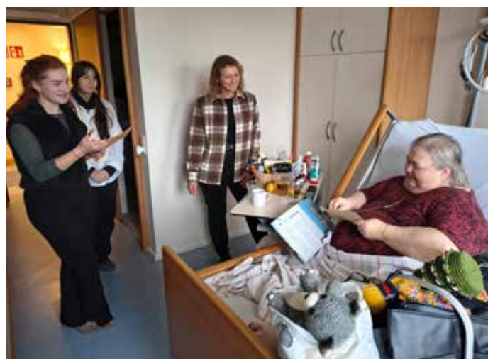
Übergabe Brief mit Häkelanleitung

Wo war Ihr Lieblingsort in jungen Jahren?