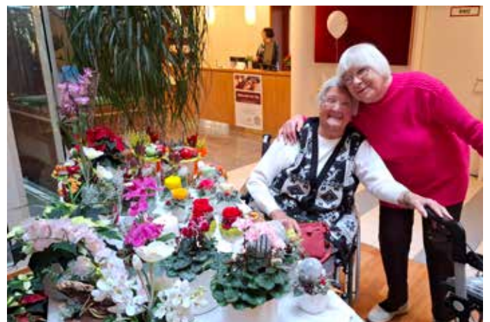
Blumenverkauf im Haus