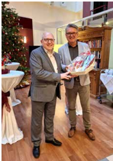
Übergabe des Präsentkorbs